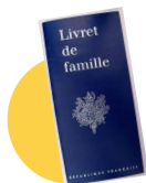
● Le livret de famille (en cas de prise en charge d'une personne mineure dont vous êtes le représentant légal )

Ce livret vous présente de façon chronologique toutes les étapes du parcours de soins au sein de notre établissement. Nous vous remercions d'en prendre connaissance et de le conserver avec vous. Vous trouverez à la fin de ce livret un rabat au sein duquel vous pourrez intégrer les documents qui vous sont remis. Vous trouverez d'ores et déjà intégrés à ce livret en annexe :