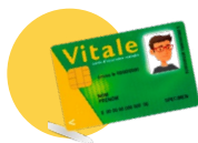
● Carte vitale